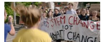
Plus chauds que le climat? 3. Zyklus + Sek II