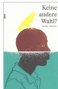
Keine andere Wahl? 3. Zyklus