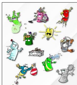
Anti-Littering e Recycling Heroes Cicli 1-3