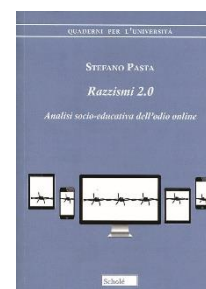
Razzismi 2.0 Sec II