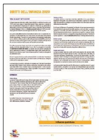
Schede sui diritti dell'infanzia 2020 Cicli 1-3