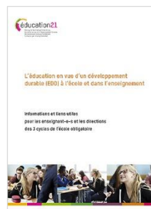
L'EDD à l'école et dans l'enseignement Cycles 1 à 3