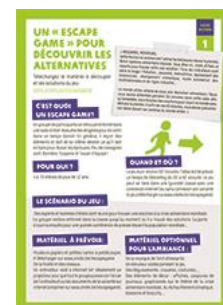
Escape game pour les alternatives alimentaires Cycle 3 et postoblig.