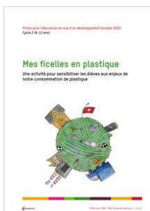
Mes ficelles en plastique Cycles 1 et 2