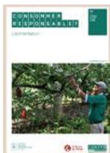
Consommer responsable ? L'alimentation Cycles 2 à sec. II