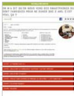
On m'a dit qu'on nous vend des smartphones ... C'est vrai, ça ? Cycles 3, sec. II