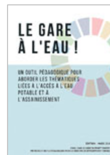
Le Gare à l'eau ! Cycle 3, sec. II