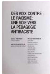
Des voix contre le racisme Cycle 3 et sec. II