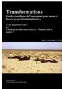
A qui appartient l'eau ? Cycles 2 à 3