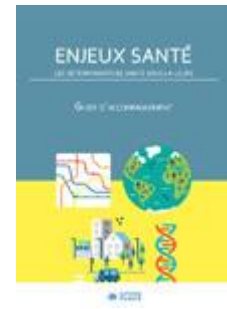
Enjeux santé Sec. II, tertiaire