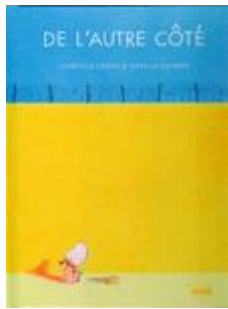
De l'autre côté Cycle 1