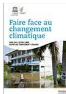
Faire face au changement climatique Cycle 2 à Sec. II