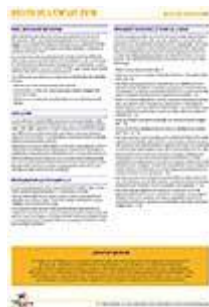
Fiches Droits de l'Enfant 2019 Cycles 1 à 3