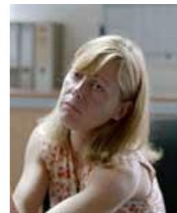
Le bleu blanc rouge de mes cheveux Sec. II