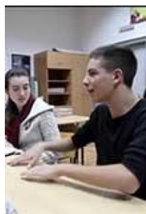
Projet Humanity Cycle 3 à sec. II