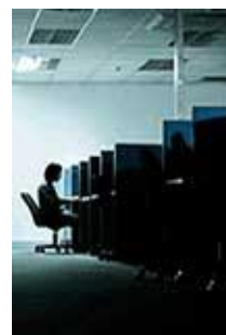
Les nettoyeurs du Web (Film) Postobligatoire