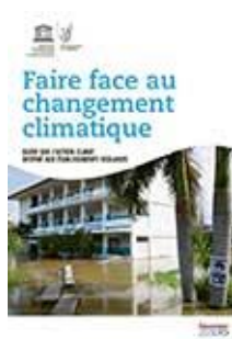
Faire face au changement climatique Cycle 2 à sec. II