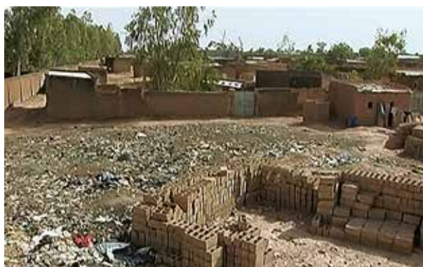
quartiere e casa di Aïcha

Compito: scrivi una breve lettera a Aïcha, nella quale: