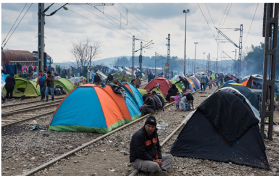
Camp de réfugié·e·s à Idomèni, en 2016, © dinosmichail

En 2016, le camp de réfugié·e·s d'Idomèni est devenu le symbole des manquements de la politique européenne des réfugié·e·s. Dans cette petite localité grecque à la frontière de la Macédoine où jusqu'à 14>000 personnes s'entassaient, au printemps 2016, dans les tentes du camp. Les conditions d'hygiène étaient catastrophiques et des débordements se sont produits entre les réfugié·e·s, les fonctionnaires macédoniens et la police grecque. En avril 2016, le camp a été fermé par les autorités grecques