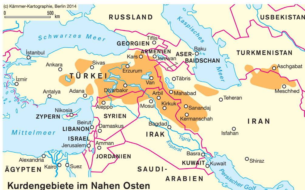
Peut être téléchargée en PDF sur www.bpb.de/internationales/europa/tuerkei/185907/der-kurdenkonflikt (Consulté le 15.10.2021).

Les Kurdes réclament aujourd'hui des territoires autonomes pour les minorités dans les différents États. Chaque province a ses propres partis et milices. En Irak, depuis la chute de Saddam Hussein, il existe un « Kurdistan irakien », un presque État. Il est dirigé par deux partis kurdes majeurs, et il a un gouvernement régional et un parlement.