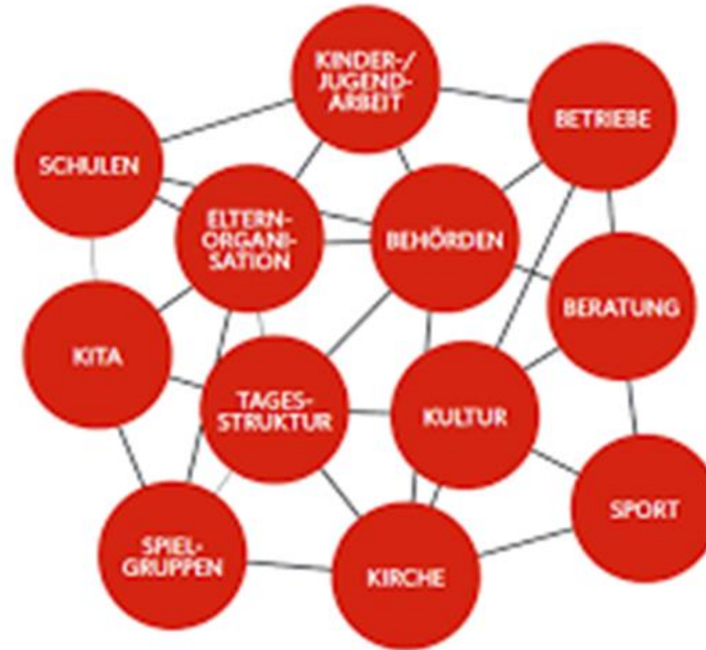
Die Bildungslandschaft als lokales oder regionales Netzwerk