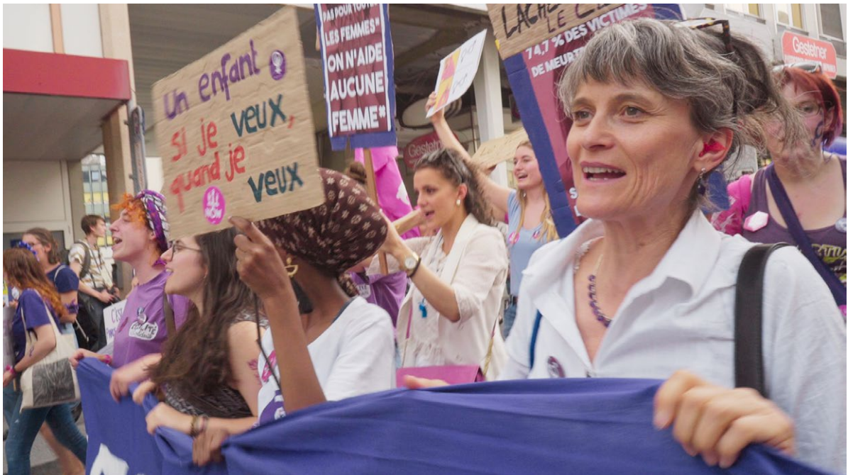
Grève des femmes, 14 juin 2019, Sion « Femmes et frères », film de Mélanie Pitteloud, Mélusine Films, 2021