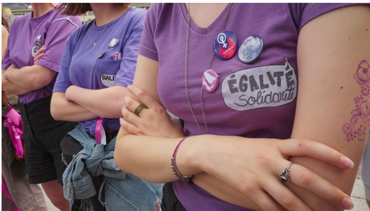
Grève des femmes, 14 juin 2019, Sion « Femmes et frères », film de Mélanie Pitteloud, Mélusine Films, 2021