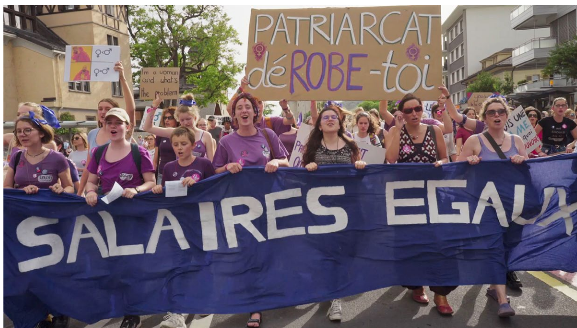
Grève des femmes, 14 juin 2019, Sion « Femmes et frères », film de Mélanie Pitteloud, Mélusine Films, 2021