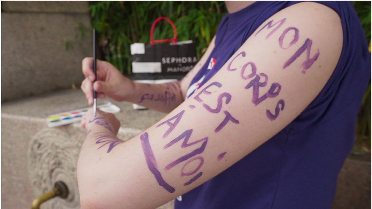
Grève des femmes, 14 juin 2019, Sion « Femmes et frères », film de Mélanie Pitteloud, Mélusine Films, 2021