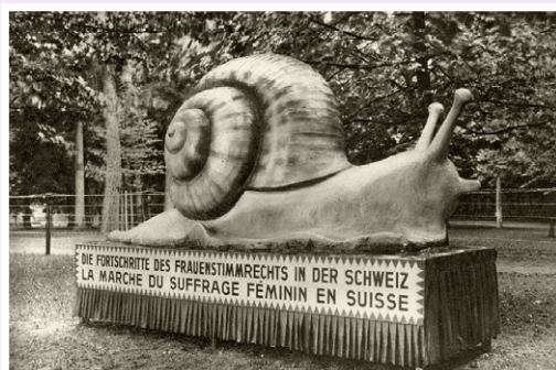
"Die Frauenstimmrechtsschnecke" ("L'escargot du suffrage féminin") Char d'une manifestation pour le suffrage féminin à Bâle, 1928