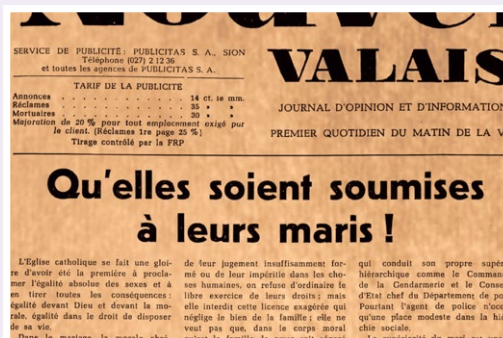
Qu'elles soient soumises à leurs maris ! Le Nouvelliste, engagé contre le vote des femmes, 1959