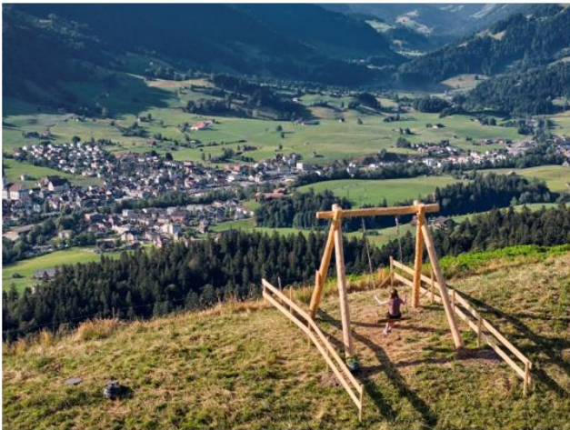
Swing the world Schaukel (Schüpfmeerg, Schüpfheim)

BNE-Lernpfad zur Lebensqualität im Entlebuch (Schüpfheim, LU)