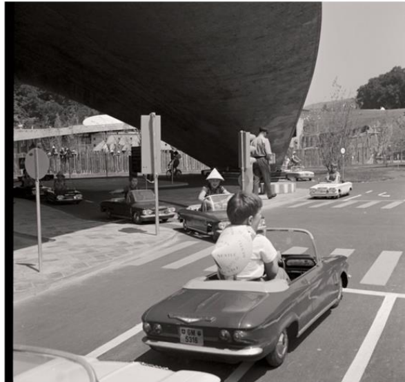
Henry Wyden, Des enfants conduisant des petites voitures dans le jardin de circulation de l'Exposition nationale, photographie, 1964 © coll. Musée Historique Lausanno, photographie Henry Wyden. Crédits : Atelier de numérisation Ville de Lausanne, Marie Humair

Balade EDD pour explorer l'espace public dans la Vallée de la Jeunesse (Lausanne, VD)