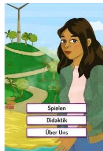
Serena Supergreen Zyklus 3