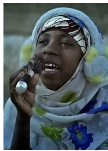
Radio Amina (Kurzfilm) Zyklus 2