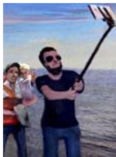
Selfies (Kurzfilm) Ab Zyklus 3