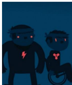
The Unstoppables Zyklus 2 und 3