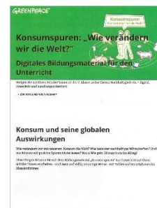
Wie verändern wir die Welt? Ab Zyklus 3