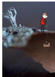
Die Katze in mir (Kurzfilm) Zyklus 1