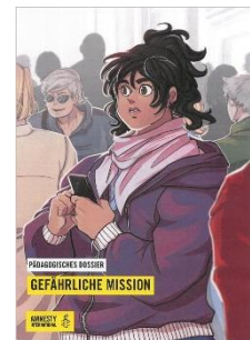
Gefährliche Mission Sek II

Wussten Sie: Nutzerinnen und Nutzer unseres VOD-Portals können Filme mit ihren Schülerinnen und Schülern zu Hause teilen (siehe Funktion "Einen Film teilen").