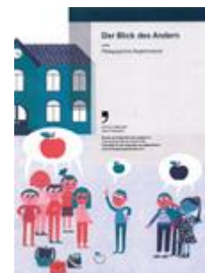
Der Blick des Anderen Ab Zyklus 3