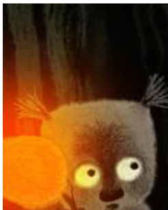
Wolkenfrüchte - Plody Mraku Zyklus 1