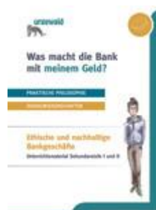
Was macht die Bank mit meinem Geld? Ab Zyklus 3