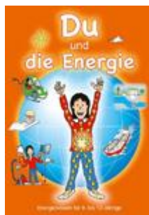
Du und die Energie Zyklus 2