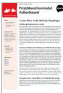
Leons Reise in die Welt des Recyclings Zyklus 1 und 2