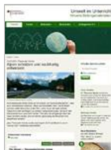
Alpen schützen und nachhaltig entwickeln Ab Zyklus 2