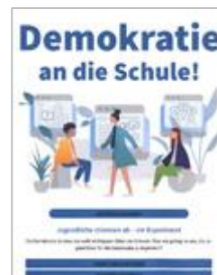
voty.ch – Demokratie an die Schule! Ab Zyklus 3