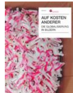
Auf Kosten anderer Ab Zyklus 3