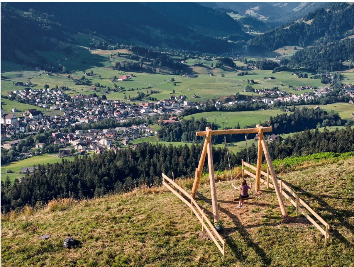
Swing the world Schaukel (Schüpferegg, Schüpfheim)

BNE-Lernpfad zur Lebensqualität im Entlebuch (Schüpfheim, LU)