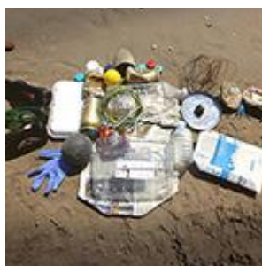
Chiripajas Cycle 1