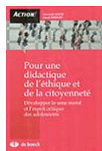
Pour une didactique de l'éthique et de la citoyenneté Secondaire II